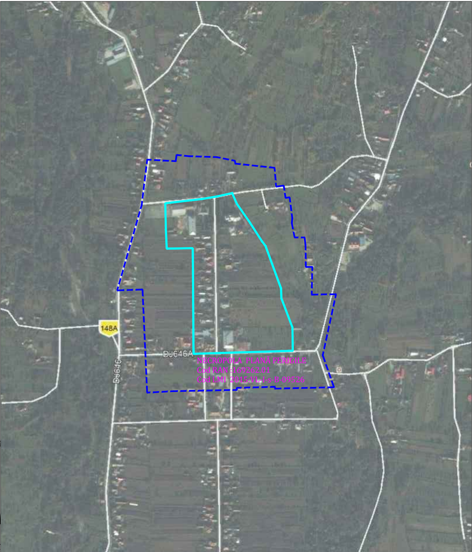
IMAGINE SATELITARA NECROPOLA PLANĂ FERIGILE

2)Necropola plană La cca. 1 km. nord de limita cimitirului tumular hallstattian, în centrul comunei Costești, pe o rază cuprinsă în linii generale, între Primărie, Școala elementară, brutărie și biserica satului, la poalele dealului Mlăcile, se află o altă necropolă hallstattiană de incinerare, în cea mai mare parte plană ( excepție face tumulul izolat 150,cu ardere pe loc, având un rug oval, cu oase calcinate, cărbuni, fragmente ceramice și două bucăți amorfe de fier ). Necropola plană ( 450-400 î.Hr.) se compune din 3grupuri de morminte, situate la distanță mare unele de altele. A fost cercetat doar grupul din curtea școlii. Pe o suprafață de 2000mp au fost săpate 28 morminte ( nr. mormintelor din acest grup nu depășea probabil 40).Un alt grup de morminte a fost semnalat în centrul comunei, la brutărie, de unde provin câteva vase descoperite întâmplător în 1955,iar al treilea grup pare a fi la cca 200m E de Primărie, unde s-a descoperit o urnă în 1942. Între aceste grupe s-a cercetat tumulul izolat 150(sec. VI-IV î. Hr.), cercetat în anul 1960. Cercetările au fost făcute pe scară redusă între anii 1963-1964 în necropola plană. Ceramica descoperită aici nu prezintă deosebiri esențiale față de necropola tumulară. Se remarcă profile de vase borcan, străchini, vase pântecoase, câni mari grosiere, mai rar ceșcuțe. Puține vase au urme de ornamente în relief sau caneluri oblice.